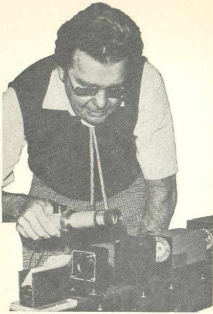
Ο καθηγητής Keith Farrell του Πανεπιστημίου της Πολιτείας Ουάσιγκτων, είναι ο υπεύθυνος του κέντρου σφραγίσματος στο LOS ALAMOS. Έδω τόν βλέπουμε μπροστά από ένα Laser.